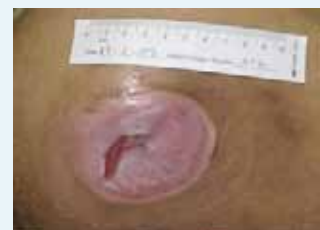
Abb. 2: Verbesserung der Wunde nach sieben Monaten